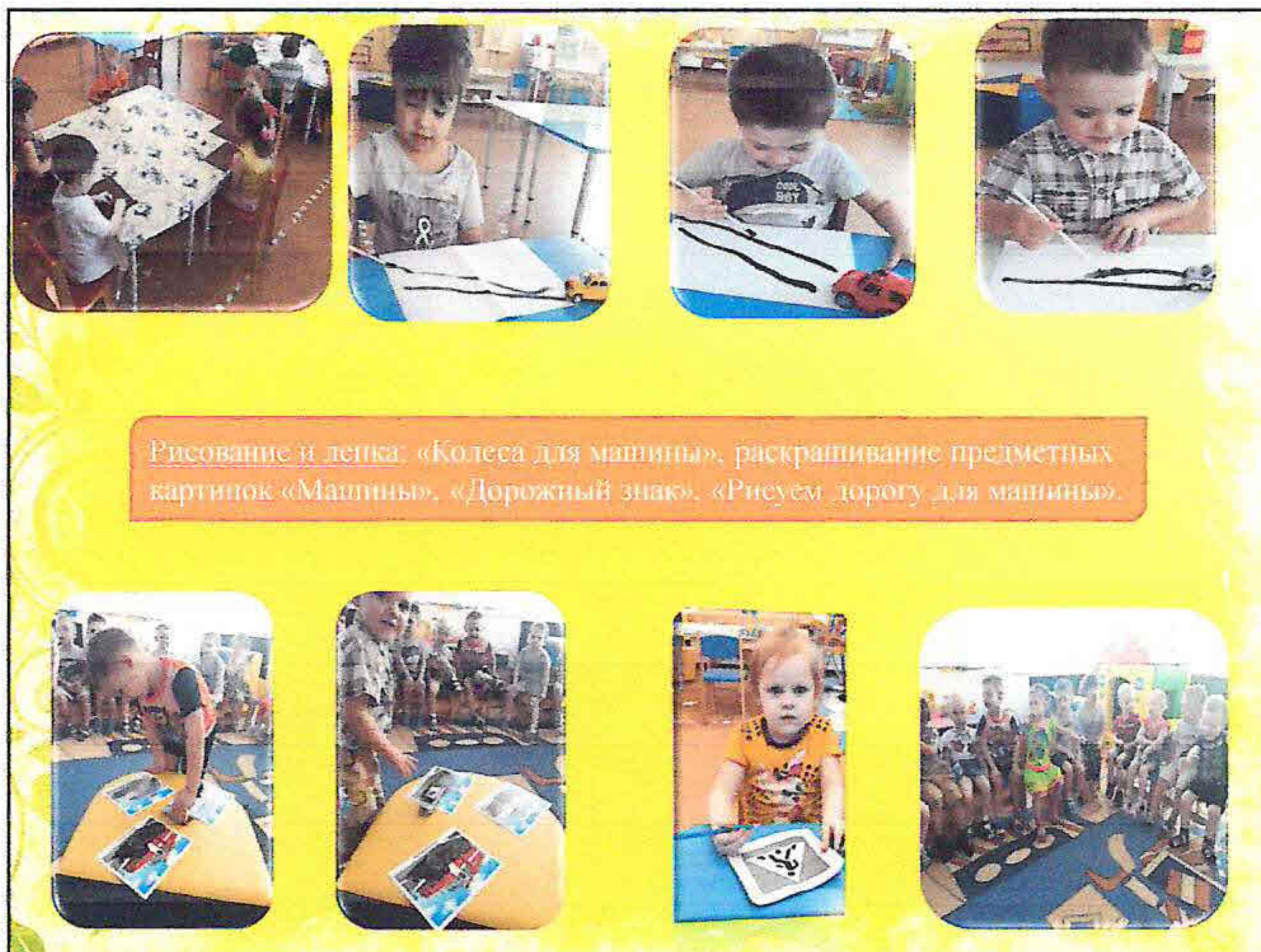
Рисование и лепка: «Колеса для машины», раскрашивание предметных картинок «Машины», «Дорожный знак», «Рисуем дорогу для машины».