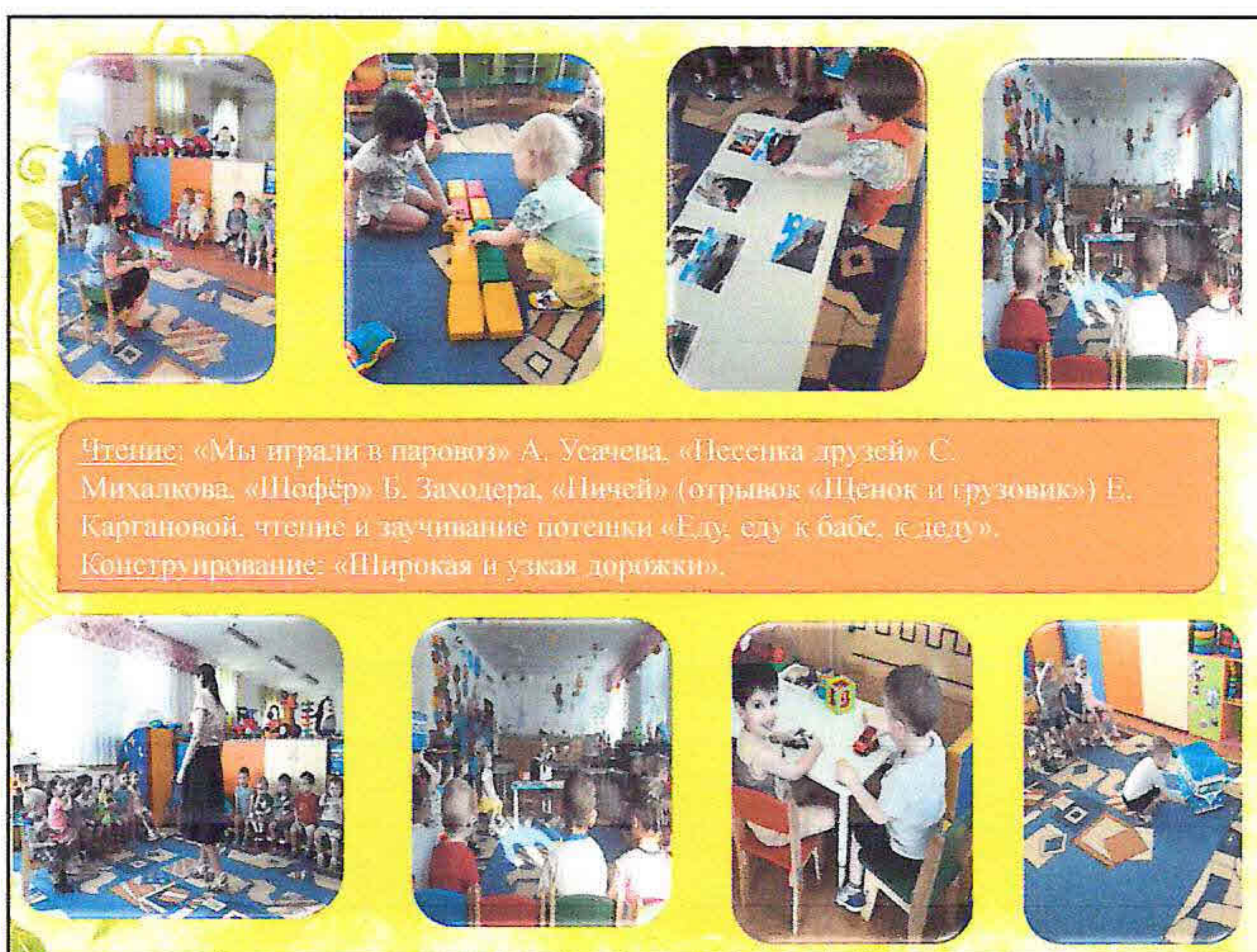
Чтение: «Мы играли в паровоз» А. Усачева, «Песенка друзей» С. Михалкова, «Шофёр» Б. Заходера, «Пичей» (отрывок «Щенок и грузовик») Е. Каргановой, чтение и заучивание потешки «Еду, еду к бабе, к деду». Конструирование: «Широкая и узкая дорожки».